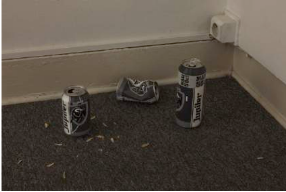
Alexandre Lavet, All the good times we spent together , 2016, peinture acrylique sur aluminium, dimensions variables.