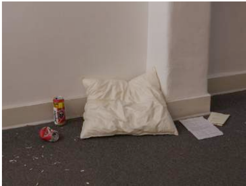
Vue de l'exposition Learn from yesterday. Live for today. Look to tomorrow. Rest this afternoon. , 2018, Deborah Bowmann, Bruxelles.