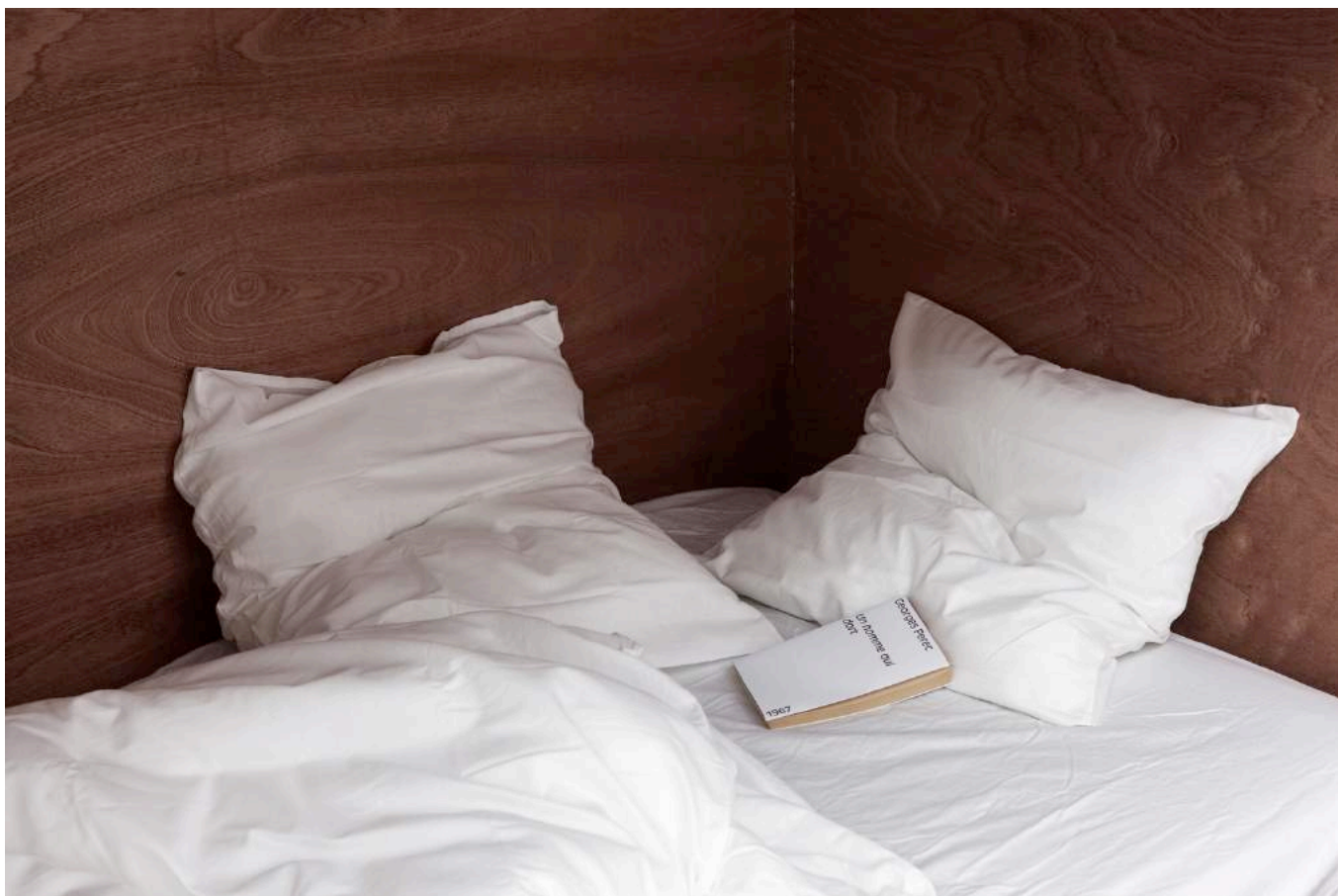
Alexandre Lavet, I would prefer not to (détail), 2017, Paris.