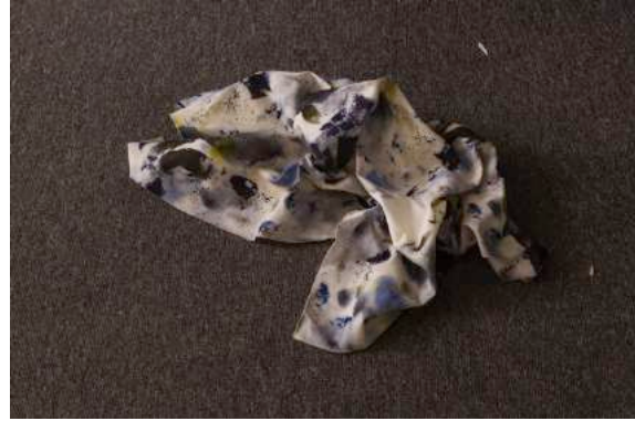
Alexandre Lavet, A dedication to my mother , 2016, impression sur coton rigidifié en collaboration avec Marine Peyraud, 10,5 x 45 x 31 cm.